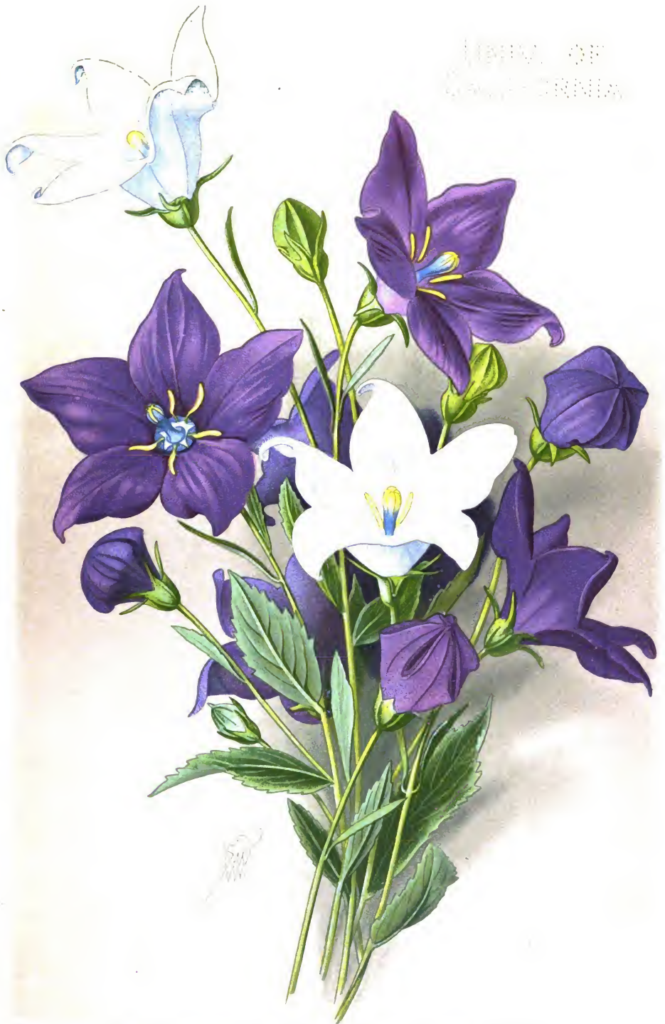
Wahlenbergia grandiflora Schrad. et var. alba .

(syn. Platycodon grandiflorum D. C. fil.)